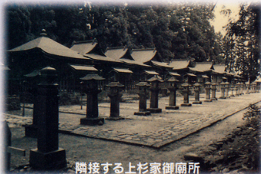
隣接する上杉家御廟所