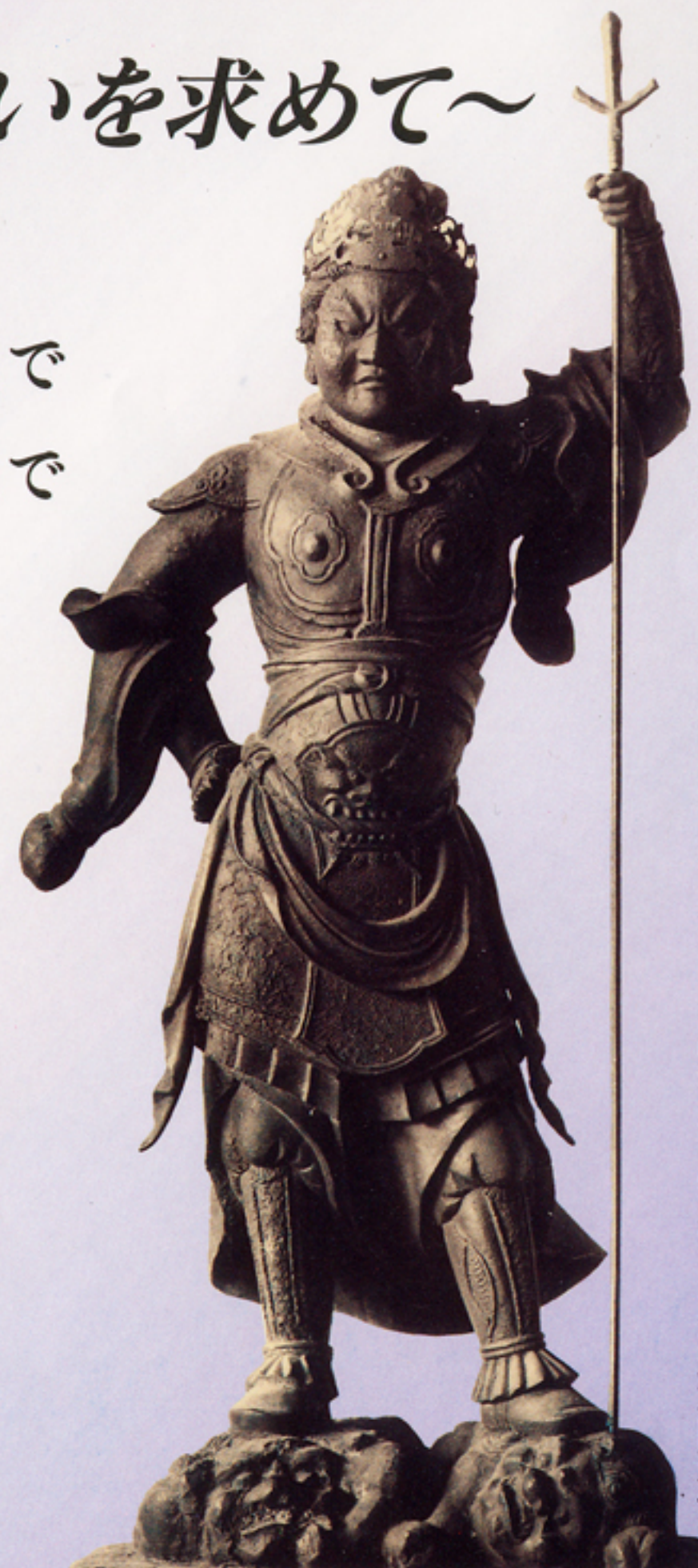
謙信公が崇拝された毘沙門天像