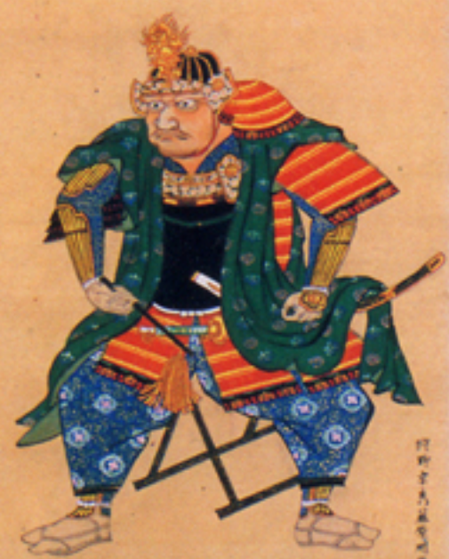
上杉弾正大弼景虎公真像